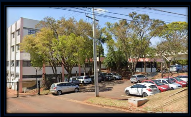
Unicamp – SP – BR